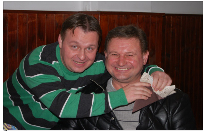
Če so inštruktorji nasmejani, je vse dobro!