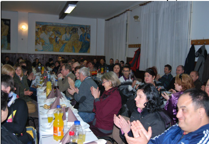
nagrajeni pa smo bili z vašo pevsko podporo in lepim aplavzom.