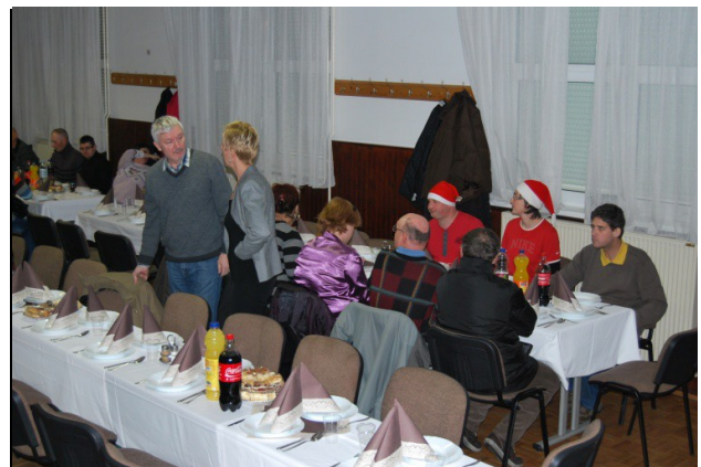
Ste opazili dva božička med nami?