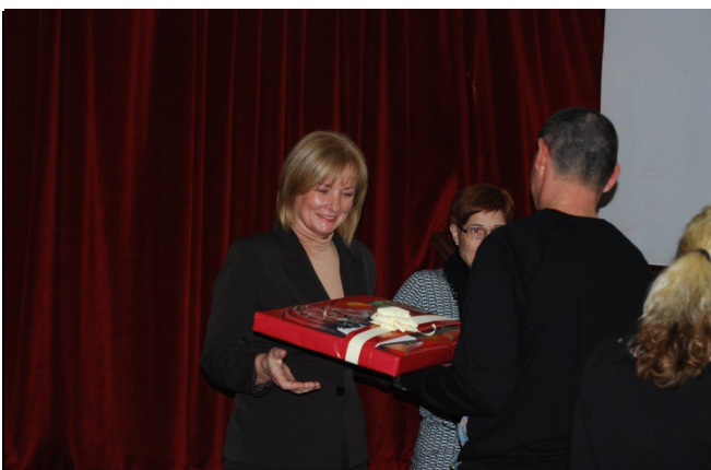
Sodelavci iz Ptuja so šefico presenetili z novoletnim darilom.