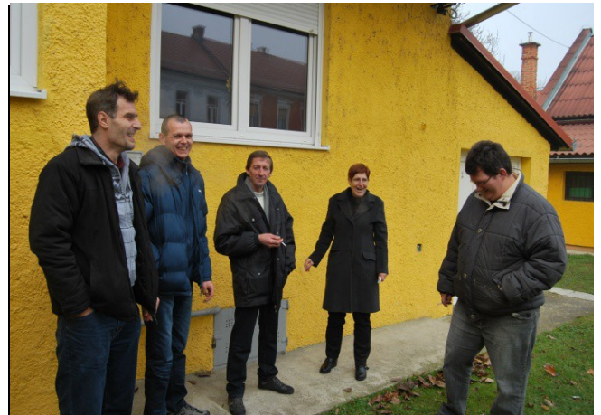
Med nastopi in jedačo ter pijačo je potrebno kakšnega pokaditi..