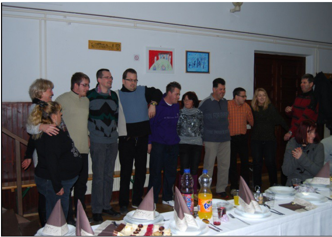
Pevci smo se nadvse zabavali ob našem nastopu,