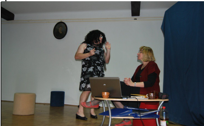
Nasmejala nas je gledališka skupina iz Vitomarcev z igro »Štirje letni časi«. Posebno še energična gospodična na levi.