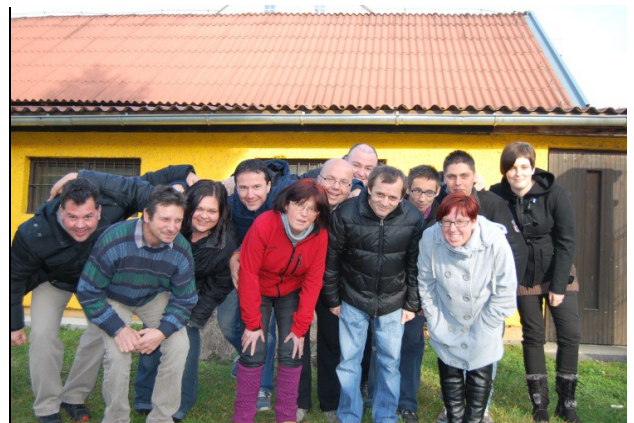
»Daj, slikaj še nas iz Preventa, ker smo ful dobre volje!«